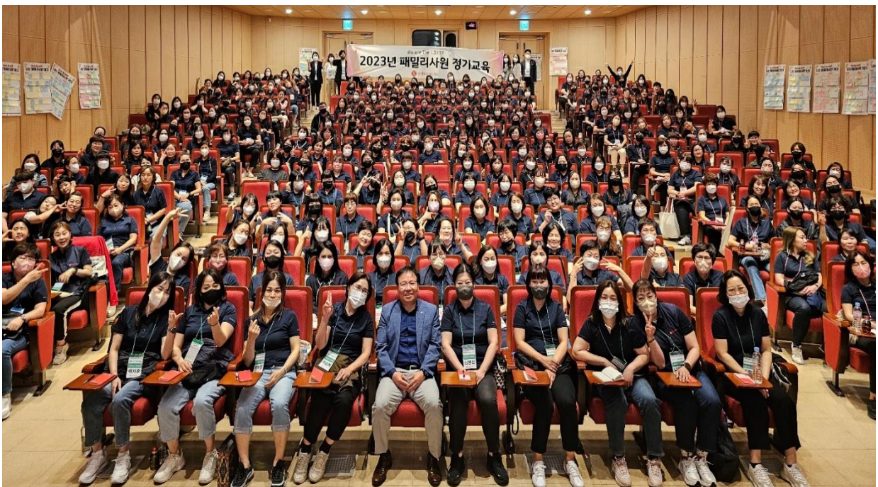
<2023년 충호지사 (대전) 정기교육 단체사진>